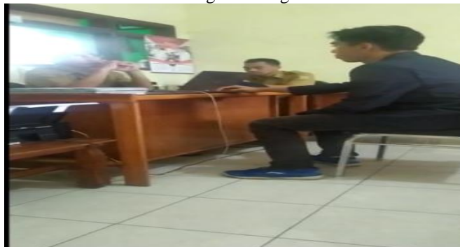
Gambar 5. Wawancara dengan salah satu Anggota KUA Kecamatan Poncokusumo

Dari tabel di atas yang kami dapatkan ketika wawancara kepada pegawai KUA Kecamatan Poncokusumo, diketahui terdapat sekitar 16 orang yang menikah pada usia di bawah 19 tahun, yaitu 1