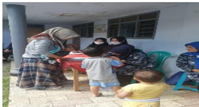
Gambar 3. Foto kegiatan pendataan Ibu-Ibu posyandu untuk kegiatan sosialisasi

Untuk mendukung data yang kami peroleh sebelumnya, kami juga melakukan kegiatan penelitian dan wawancara kepada perangkat Pemerintah Desa Pandansari dan KUA Kecamatan Poncokusumo terkait pendataan usia masyarakat yang menikah di tahun 2022 dan problem atau masalah dari pernikahan dini itu sendiri, hasil penelitian tersebut yaitu usia rata-rata remaja yang melakukan pernikahan itu ada pada kisaran usia 18-19 keatas tahun bagi pria atau dengan kata lain setelah tamat Sekolah Menengah Atas (SMA) ataupun Madrasah Aliyah (MA) sedangkan untuk wanita ada pada kisaran 16-18 tahun, akan tetapi ada beberapa narasumber juga yang mengatakan bahwa hanya selisih beberapa bulan sebelum mencapai usia 19 tahun. Hal tersebut biasanya dilatarbelakangi oleh sikap buru-buru orang tua atau remaja itu sendiri untuk melaksanakan pernikahan dengan alasan takut terjerumus pada pergaulan bebas atau perzinahan. Menurut data yang kami dapatkan, pada tahun 2022 mulai bulan Januari hingga Desember terdapat 1 orang laki-laki dan 15 perempuan yang menikah pada usia di bawah 19 tahun di Desa Pandansari, Kecamatan Poncokusumo, Kabupaten Malang. Berikut hasil wawancara dan data pernikahan Desa Pandansari bulan Januari-Desember tahun 2022: