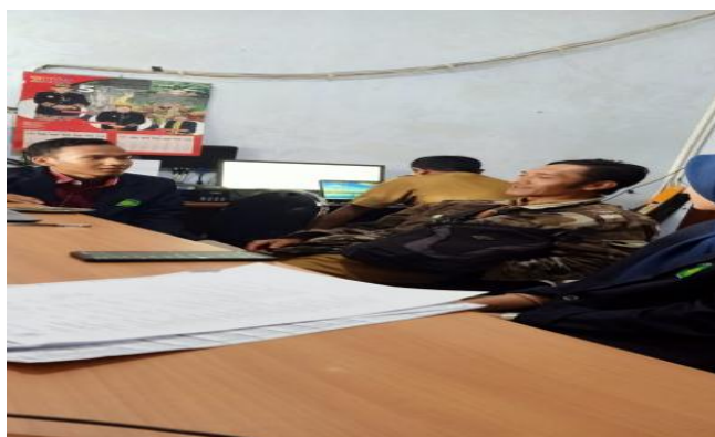
Gambar 4. Wawancara dengan Perangkat Desa Pandansari